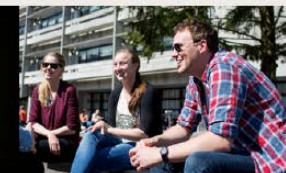
Bli raskt kjent med dine medstudenter i klassemottaket.