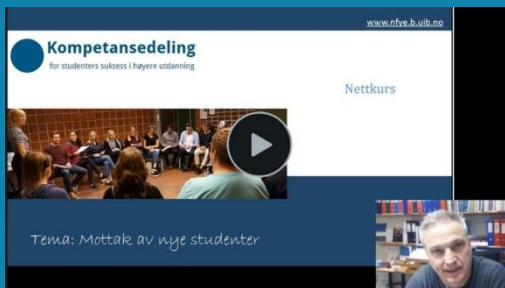
Nettkurs januar – mars 2019 ved Harald Å. Sæthre