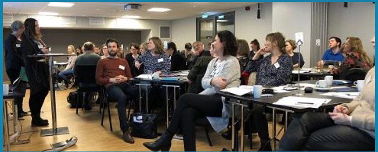
Plenum - arbeidsseminaret «Mottak og førstesemester» 14.-15. mars